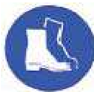
Calçado de Protecção